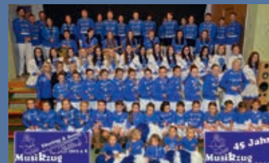
Musikzug Eiterfeld Arzell