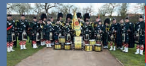
Targe of Gordon pipe and Drumband

Einfach Einmalig... Großes Konzert im Zelt mit insgesamt 100 Musiker auf einer Bühne (Im Anschluss an den Festumzug)