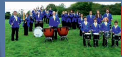
Schalmeien Haiger Schalmieien Haiger