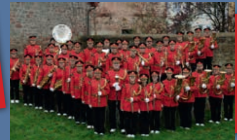
Musik Corps Tann Rhön