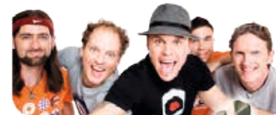
borderline The Greatest Hits Show